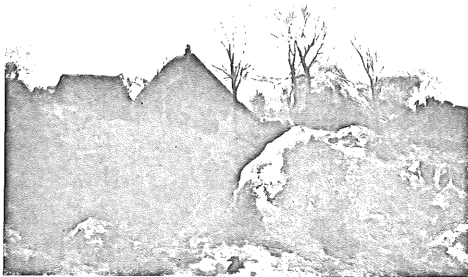
PAVSAE A LA PLAINA AUA ROCAHLES (Haute-Savoie)