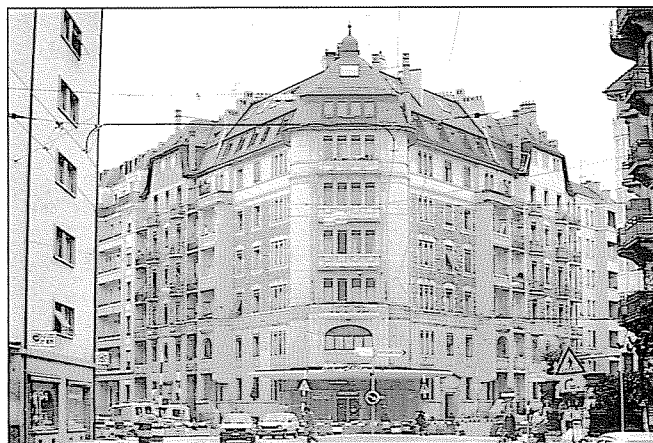
A gauche, l'avenue du Devin-du-Village. A droite, la rue du Contrat-Social