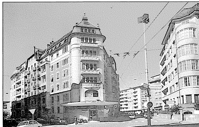
Avenue du Devin-du-Village 6. 4: rue du Contrat-Social 1 A droite, l'avenue De-Gallatin 1